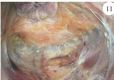
图11 经肛打开直肠黏膜后,从 直肠后方游离进入直肠后间隙

离直肠系膜,前方打开腹膜反折,将游离远端直肠翻转入腹腔,向近端游离、结扎肠系膜下血管 [5] 。